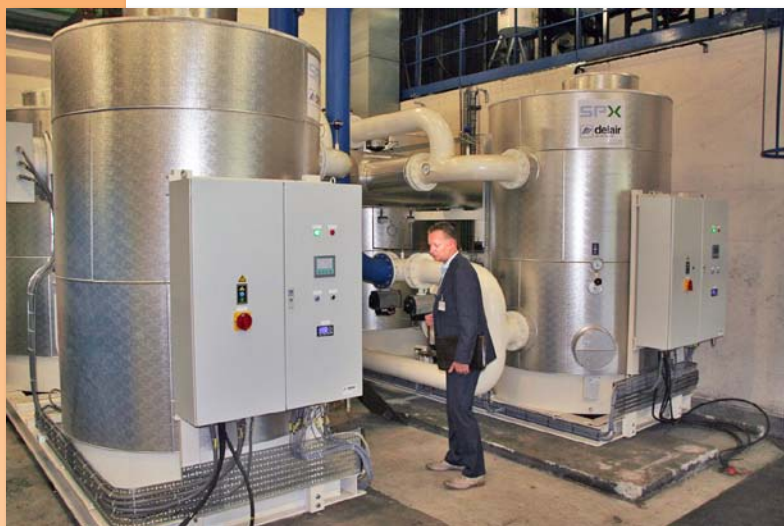
22 000 m 3 /h traités par 2 x Sécheurs DB 33 - (11 000 m 3 /h unitaire)

Un peu moins connus, du fait de leur taille réservée aux débits importants, les sécheurs SPX (Groupe Deltech) série DB sont conçus pour satisfaire les utilisateurs les plus exigeants.